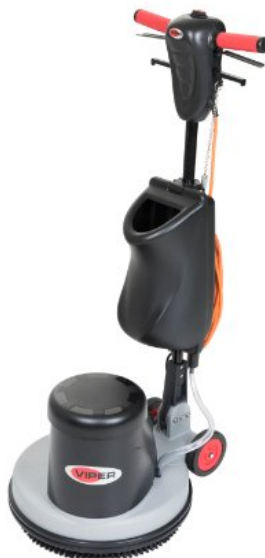
De getoonde afbeelding kan afwijken van het gekozen type

De VIPER DS350 is een veelzijdige duospeed machine geschikt voor verschillende professionele reinigingswerkzaamheden. Schrobben, spray cleaning en boen werkzaamheden. Door een professioneel ontwerp kunnen wij deze VIPER eenschijfsmachine aanbieden tegen een zeer aantrekkelijk prijs/kwaliteit verhouding. De bediening is heel eenvoudig. Deze VIPER DS350 eenschijf duospeedmachine is robuust, betrouwbaar en service/onderhoudsvriendelijk. Dankzij het ergonomische ontwerp is het eenvoudig om vloeren te schrobben, spray-reinigen en te boenen. De VIPER DS350 duospeed is meteen klaar voor gebruik en wordt geleverd inclusief tank, schrobborstel en padhouder. Optioneel zijn een schuimgenerator en een tapijtborstel leverbaar.