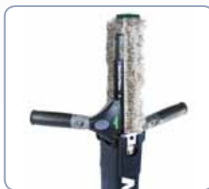
Voor links- en rechtshandigen