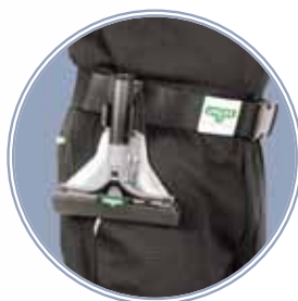
clip voor aan de riem

Verkrijgbaar in twee afmetingen: 10 cm 15 cm