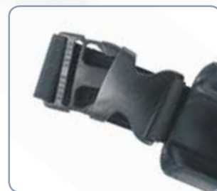
Clip-sluiting voor snelle bevestiging aan de riem.