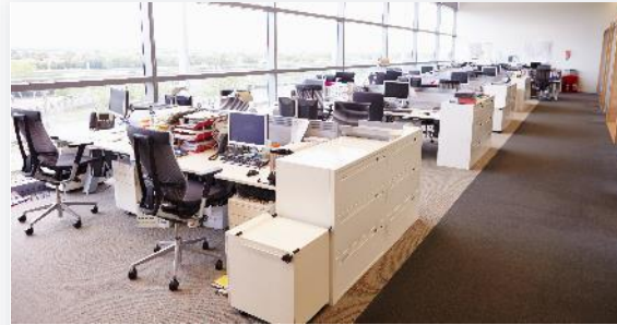
Overheidsdiensten en -kantoren