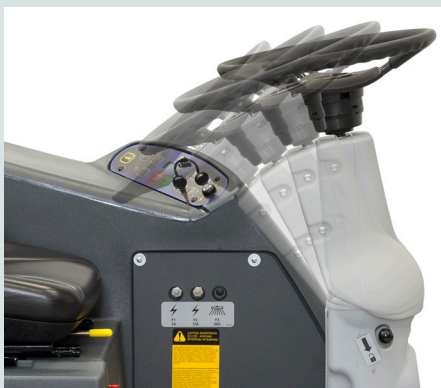
Kantelbaar stuur om eenvoudig op te stappen. Ergonomisch ontworpen bestuurdersplaats voor veiligheid en comfort.