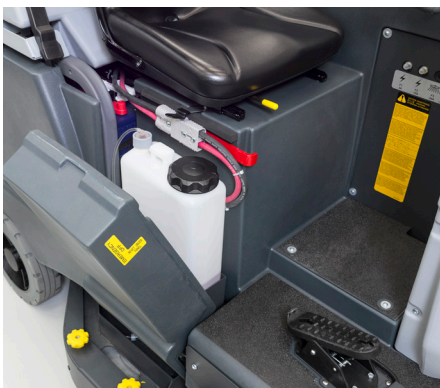
Ecoflex reinigingsmiddel kit (optioneel): eenvoudig toegankelijke reinigingsmiddel tank.