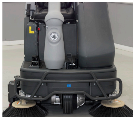
Dubbele zijborstels (cilindrische modellen) zorgen er voor dat de randen echt schoon worden.

Het unieke Ecoflex-systeem stelt de gebruiker in staat om de prestaties van de schrobzuigmachine aan te passen aan de vervuiling op de vloer en het vereiste reinigingsniveau. Als de gebruiker meer vuile plekken op de vloer aantreft, kan hij de Ecoflex knop gebruiken voor tijdelijk extra vermogen en even gemakkelijk terugkeren naar de oorspronkelijke instellingen voor een minimaal gebruik van water, schoonmaakmiddel en energie.