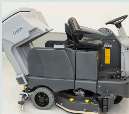
Kantelbare en afneembare vuilwatertank.