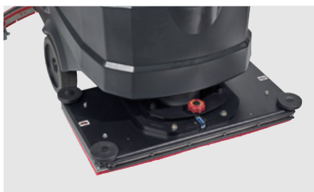
Orbitale schrobzuigmachine voor het reinigen van de vloer of het strippen van de toplaag/lak (AS7190TO)