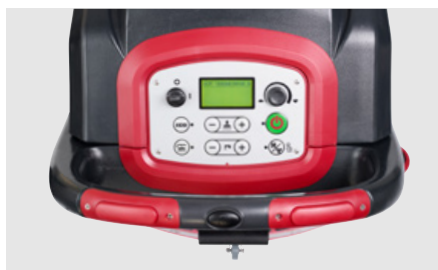
Intuïtief bedieningspaneel met LCD-scherm voor alle modellen (AS6690T/AS7690T afgebeeld)