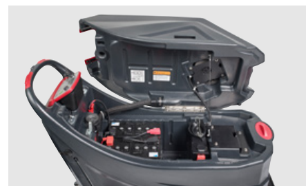
Vuilwatertank met handgreep om het kantelen te vereenvoudigen